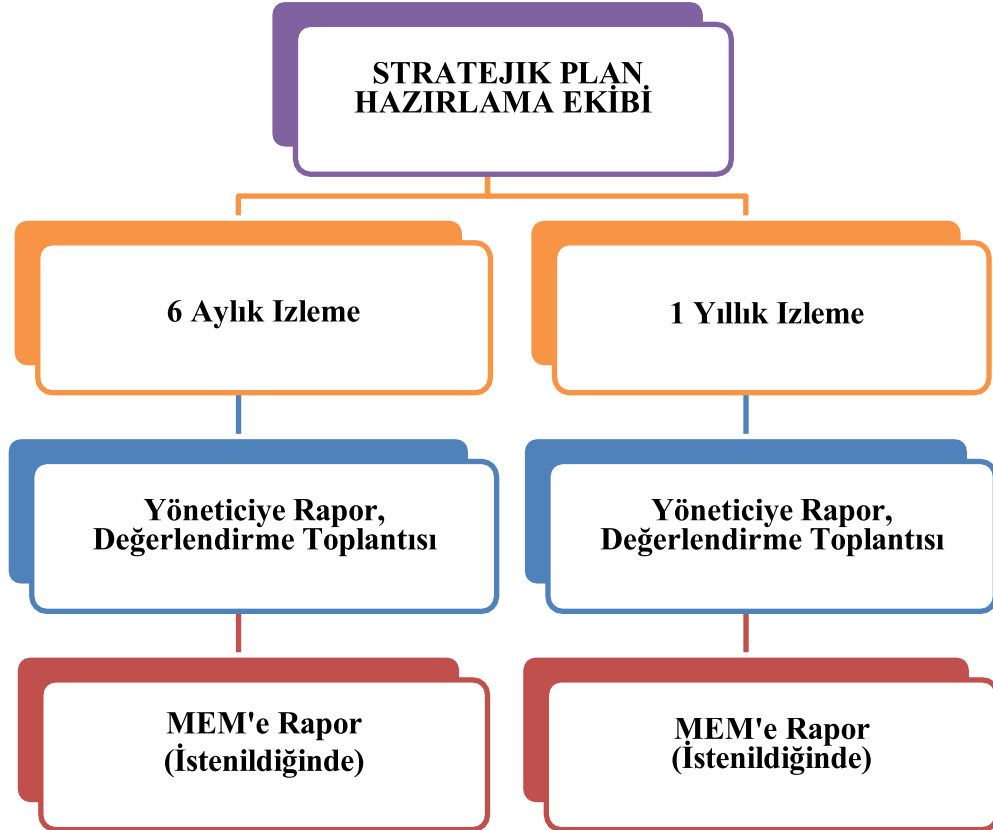
Şekil 2 İzleme ve Değerlendirme Süreci

İzleme ve değerlendirmenin etkin bir şekilde gerçekleştirilmesi, karşılaşılan sorunlara gerekli müdahalelerin zamanında yapılması yanında, izleme ve değerlendirme sonucunda çıkarılacak derslerin ve edinilecek tecrübelerin hazırlanacak yeni plan ve program hazırlıklarında kullanılması açısından önem arz etmektedir.